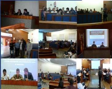
Collage de fotos de las diferentes jornadas del Seminario de Noviembre