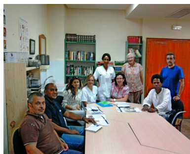
Personal del Hospital Sar Quavitae de Sagunto y Miembros de Fundación Cronos Vida y Cultura.